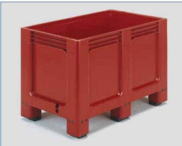
2725 - Jumbo - 250 Lit. - 13,5 kg ext. 1000 x 600 x h 662 mm int. 929 x 544 x h 519 mm