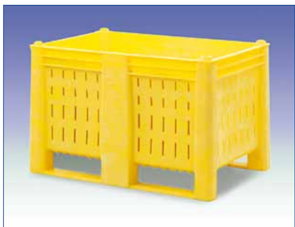
P-120801 - 500 Lit. - poids: 31,0 kg ext. 1200 x 800 x 740 mm - int. 1120 x 720 x 600 mm P-120801/R - sur roues (hauteur totale: 795 mm) Coloris: jaune. Sur demande en brun ou bleu P-1208 - couvercle - Coloris: blanc - poids: 3 kg