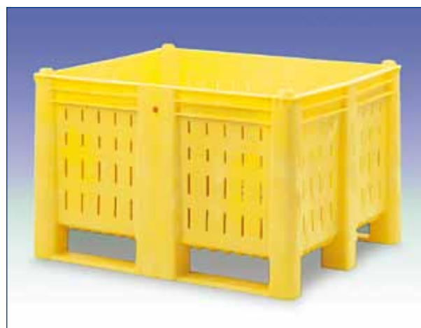
P-121001 - 600 Lit. - poids: 36,0 kg ext. 1200 x 1000 x 740 mm - int. 1120 x 920 x 600 mm P-121001/R - sur roues (hauteur totale: 960 mm) Coloris: jaune. Sur demande en brun ou bleu P-1210 - couvercle - Coloris: blanc - poids: 3,8 kg