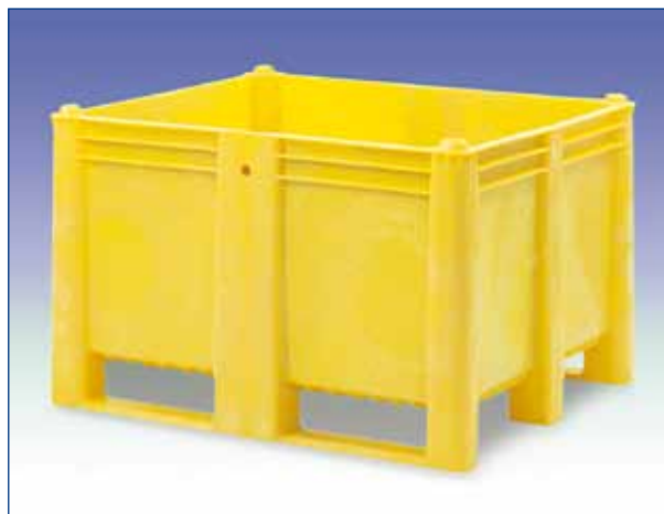
P-121004 - 600 Lit. - poids: 36,5 kg ext. 1200 x 1000 x 740 mm - int. 1120 x 920 x 600 mm P-121004/R - sur roues (hauteur totale: 960 mm) Coloris: jaune. Sur demande en brun ou bleu P-1210 - couvercle - Coloris: blanc - poids: 3,8 kg