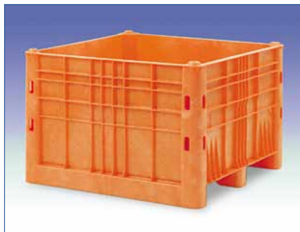
LIVRABLES EN PLUSIEURS COLORIS ET DIMENSIONS: 1120 X 1120 mm & 1600 x 1050 mm