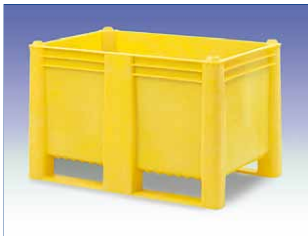
P-120804 - 500 Lit. - poids: 31,5 kg ext. 1200 x 800 x 740 mm - int. 1120 x 720 x 600 mm P-120804/R - sur roues (hauteur totale: 795 mm) Coloris: jaune. Sur demande en brun ou bleu P-1208 - couvercle - Coloris: blanc - poids: 3 kg