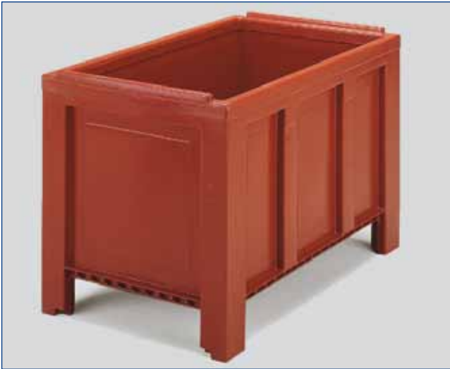
2125 - Jumbo - 250 Lit. - 18,5 kg ext. 1000 x 600 x h 662 mm int. 934 x 534 x h 502 mm