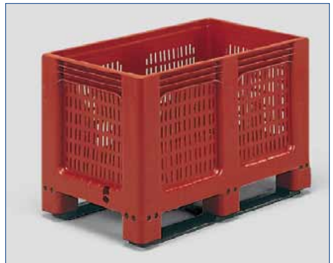
2725-0 - Jumbo - 250 Lit. - 12,5 kg ext. 1000 x 600 x h 662 mm int. 929 x 534 x h 519 mm