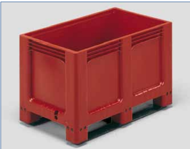
2727 - Jumbo - 250 Lit. - 12,7 kg ext. 1000 x 600 x h 662 mm int. 929 x 544 x h 519 mm