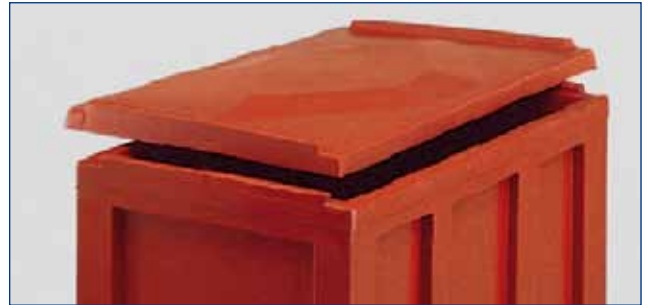
P-2125 - couvercle pour réf. 2125 - 2,50 kg ext. 1024 x 615 x h 40 mm