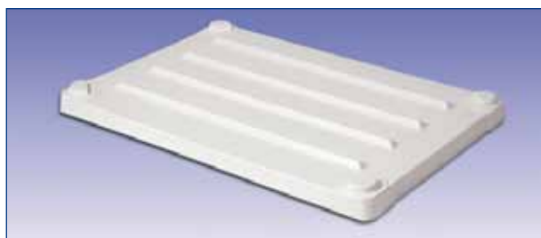
P-1208 - couvercle pour 1200 x 800 mm P-1210 - couvercle pour 1200 x 1000 mm